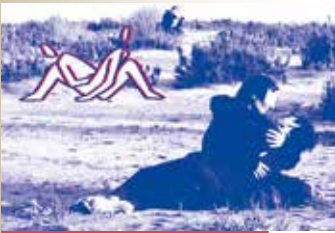
Cie des Corps Parlants © Alouette sans tête

Très-Cloîtres | https://cie-scalene.com/ | Inspirez, expirez, inspirez-vous... de l'énergie, celle que nous communiquons aux autres autant que de celle qui anime nos objets. Et si, en plus d'avoir une activité physique, vous pouviez créer de l'énergie pour une création artistique ? La Cie Scalène vous invite à COMME UN RAYONNEMENT #3 , pièces chorégraphiques autonomes en énergie, où les danseuses sont éclairées par l'énergie de vélos, guidés par le maître des lumières - en partenariat avec ass. SETE. LA TÊTE DANS LE GUIDON , où vous pourrez pédaler et charger l'alimentation des performances de la semaine. LA BOUM ÉLECTRIQUE | jeune public | Pour danser et... pédaler. Dans cette boum, il faut que des personnes pédalent pour que d'autres dansent ! Suivez le rythme, les gestes et amusez-vous !