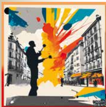
Jérôme Vion © DR