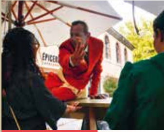
La 4 ème Dimension © Elise Oclru

LYRISTRADA / OPÉRA SOUS-MARIN | Musique, Philosophie | A la Cour de l'Alma, 42 rue Très-Cloîtres | Inspirez...Plongez ! Du clapotis des vagues au silence des Abysses, du chant des coquillage à l'appel du large, Prenons notre inspiration et plongeons dans les fonds marins à l'écoute des sons de la mer. Ouverture exceptionnelle des Abysses pour tenter de découvrir l'univers sonore et artistique de créatures inconnues.