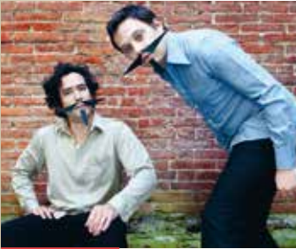
Cie Le Chat du Désert