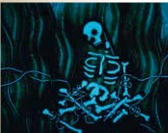
Cie les Zinzins + Cie Ithéré + Cie Noodles / Ardeurs Boréales