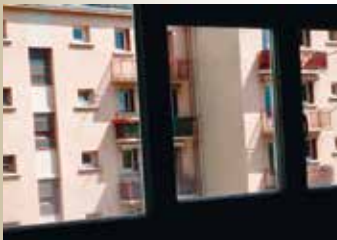
Les Productions du Bazar