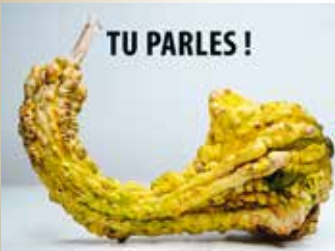
Cie Les Voisins du Dessous