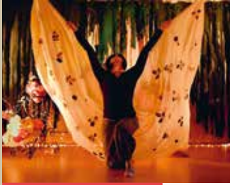
La Fabrique à Merveilles © Claire Gillet