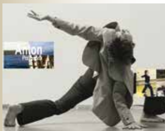
Collectif K-LI-P © Daniela, A. Incoronato, P Veyrunes