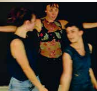
Cie Scalène